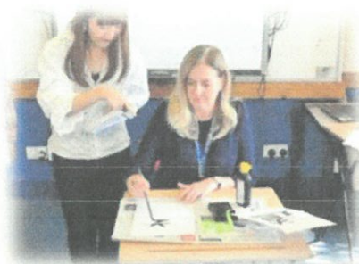
写真: 書道の模擬授業の様子